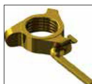
Ecrou ergonomique ajusté