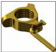
Ecrou ergonomique ajusté