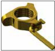
Ecrou ergonomique ajusté