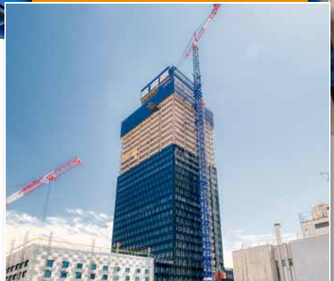
Baustelle: To-Lyon ■ Kunde: Vinci ■ Ort: Lyon